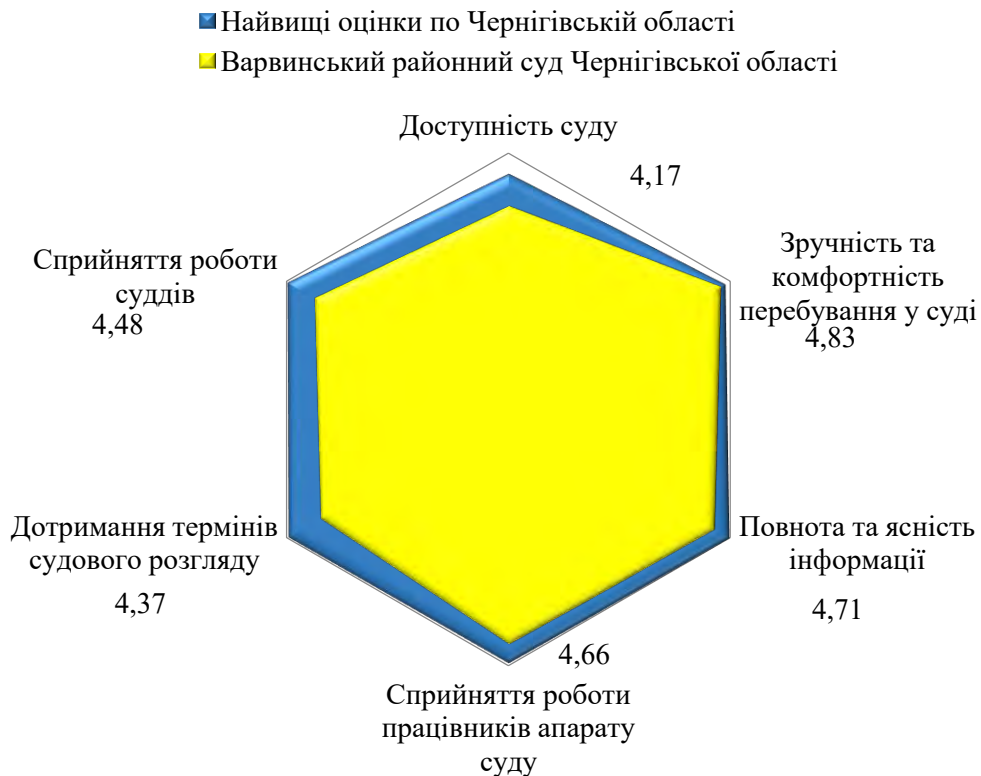
Рис.1.4. Якість роботи Варвинського районного суду за основними вимірами