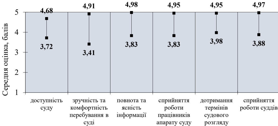
Рис. 2.1. Розподіл вимірів якості за діапазоном їх зміни по судах Чернігівської області

В той же час, аналіз якості роботи суду за основними вимірами свідчить про певну диференціацію судів (рис.2.1)